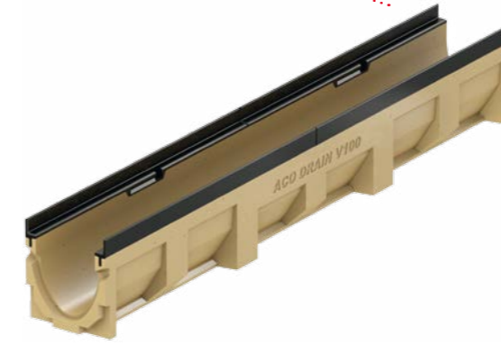
Защитен ръб от чугун