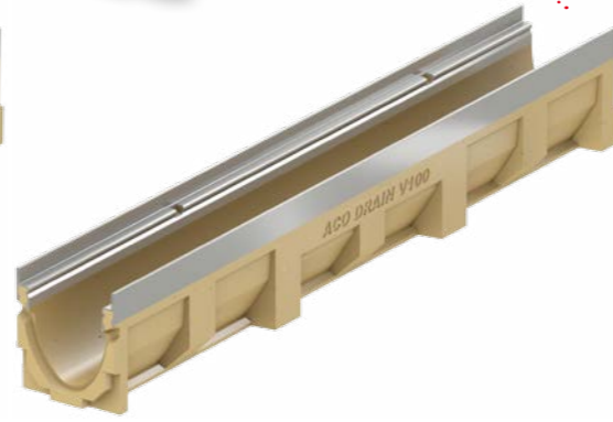
Защитен ръб от неръждаема стомана