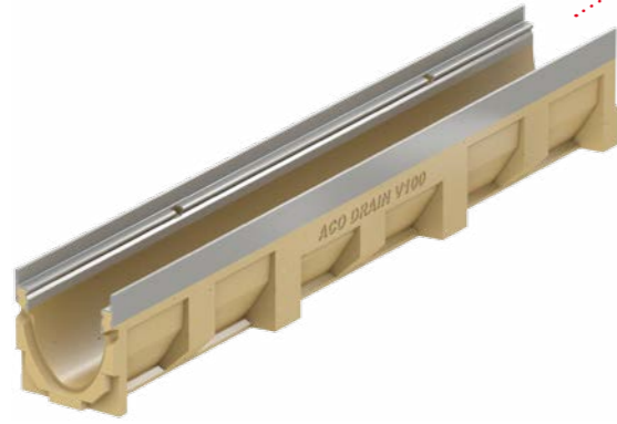
Защитен ръб от поцинкована стомана