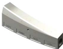
Елемент с наклон