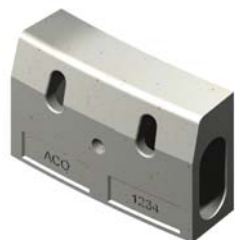
Радиус (за система 305 & 480)