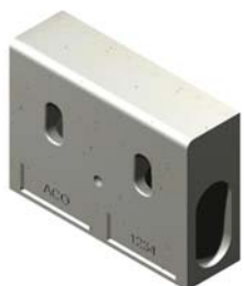
Елемент за автобусни спирки