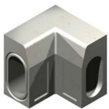
Вътрешен ъгъл (за системата 305)