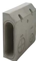
Скосен елемент (за системата 480)