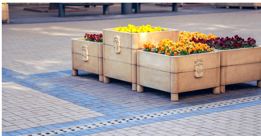
ACO Monoblock PD - монолитни отводнителни улеи

Достъпът на операторите до комуникационните шахти е улеснен и едновременно с това защитен от неоторизирано отваряне. Самонивелиращите се капаци за ревизионни шахти ACO Multitor с логото на Столицата допринасят за характера и атмосферата на Булеварда, който освен притегателен център за жителите на града е и ключова туристическа дестинация.