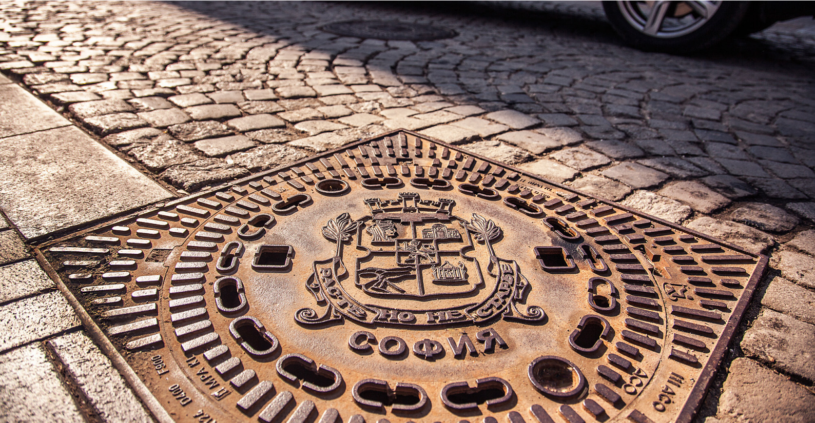
ACO Multitop - капацы за ревизионни шахти с визуализиран герб